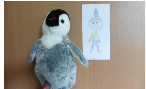
Maskottchen der Klassen 1a und 1b