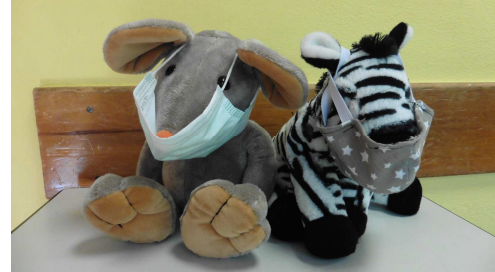
Anton und Ayo, die Klassentiere der Klassen 1a und 1b