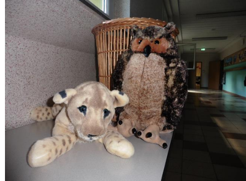
die Klassentiere der Klassen 1a und 1b