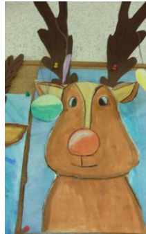
Rentier, Klasse 3a