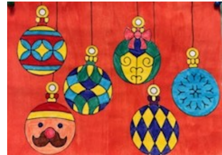
Weihnachtskugeln Kl. 3a